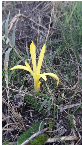
Фотографије јединки Sternbergia colchiciflora – бабалушка/ арбó vetõvirág са терена

И током 2024. године, чуварска служба је у континуитету евидентирала појаву одрасле (старе) јединке орла крсташа ( Aquila heliaca ) на заштићеном подручју и у заштитној зони ПИО „Кањишки јарашки“.