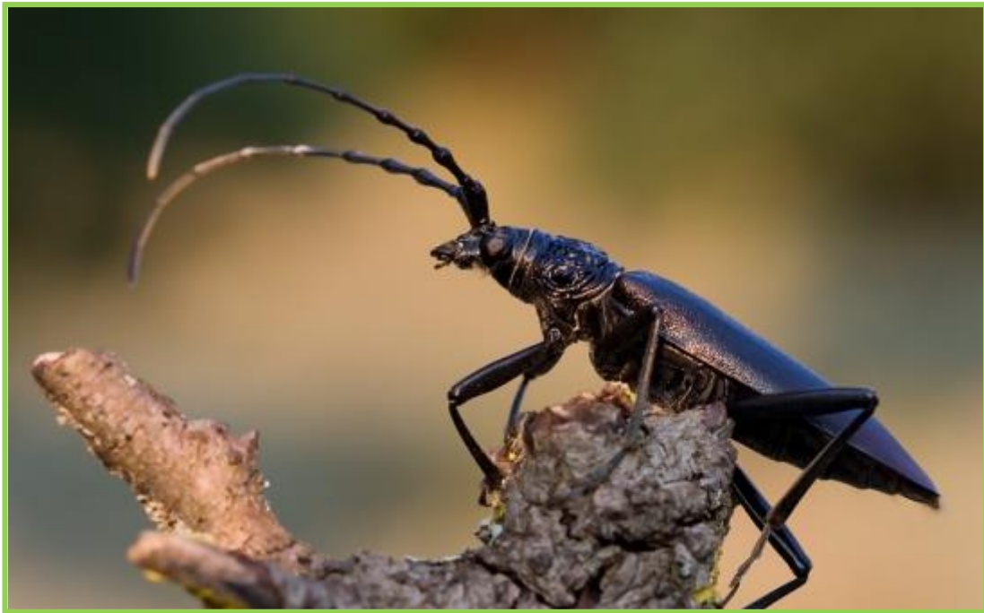
Фотографија 4. Хрстова стрижибуба ( Cerambyx cerdo ).

Поред горе наведеног, чуварска служба је евидентирала гнезда птица и дупље слепих мишева на јединкама хрстова.