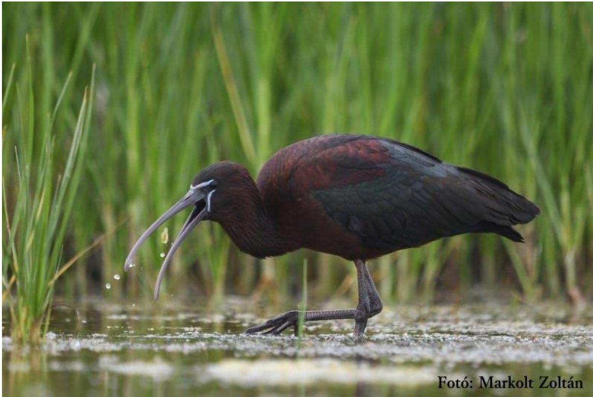
Ражањ (Плегадис фалцинеллус)

А посебно нас је обрадовала повратак веома ретких врста птица као што су чапља говедарка (Бубулцус ибис) и ражањ (Плегадис фалцинеллус)