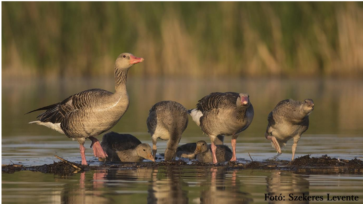
Дивље гуске (Ансер ансер)

Пошто је број бивола повећан са једним домаћим биком и новорођеним прираштајем били смо приморани да им станиште повећамо, што смо и учинили заграђивањем 2,5 ха са леве стране ушћа. Планирано је да у оквиру КФВ пројекта Заштита биодиверзитета и вода језера Палић и Лудаш, на овој територији подигнемо једну осматрачницу за посматрање птица.