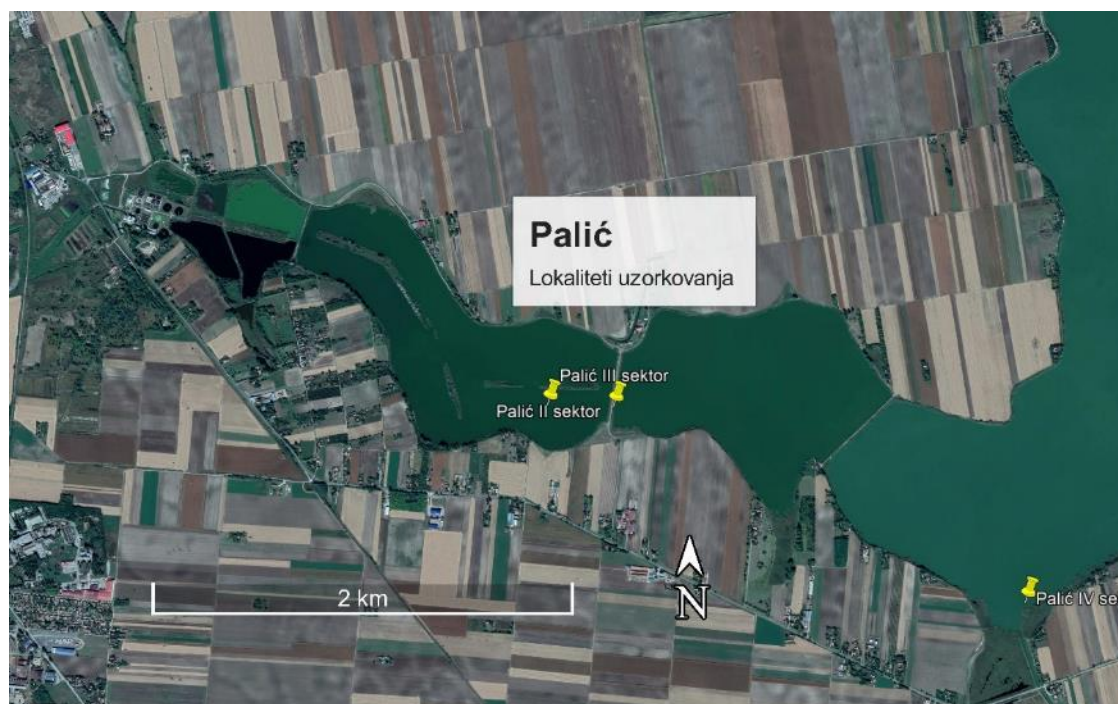
Slika 1. Lokaliteti uzorkovanja