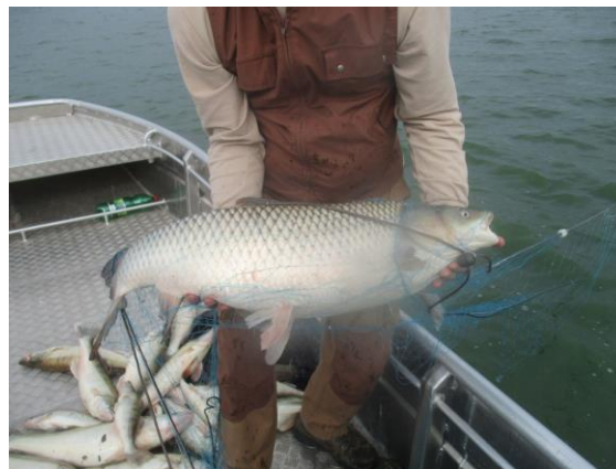
Amur preko 10 kg