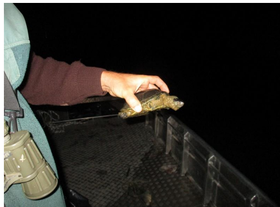
Barska kornjača vađena iz mreže