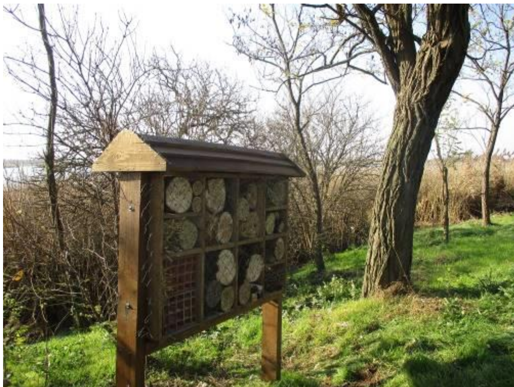
Слика 6. „Хотел за инсекте“ код Визиторског центра „Лудаш“

У оквиру пројекта „Унапређење стања и презентације Специјалног резервата природе Лудашко језеро“ Покрајински секретаријат за урбанизам, градитељство и заштите животне средине је 2015. године суфинансирао опремање комплекса Визиторског центра „Лудаш“: куповина кревета (20), опремање библиотеке полицама, столовима и столицама, израда и постављање дрвене конструкције за пчеле и дрвених кућица за птице. Набавка свега наведеног је реализована током 2015. године, али је све постављено 2016. године.