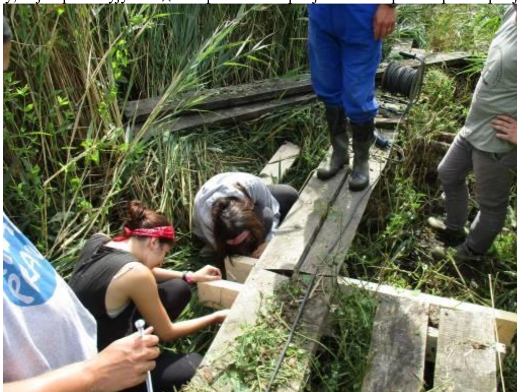
Слика 2. Поправка мола и мобилијара

Током године је реализована поправка (замена носача, лакирање, фарбање) едукативних табли, канти и осматрачница дуж едукативних стаза. Реновирано је мол код птичарске колибе на едукативној стази „Киреш“ и то из сопствених средстава и средстава Града Суботице по уговору број: П-401-763/2016 од 22.06.2016.) кроз активности волонтера током трајања Међународног волонтерског радног кампа на Лудашу, који организују Млади истраживачи Србије/ Волонтерски сервис Србије.