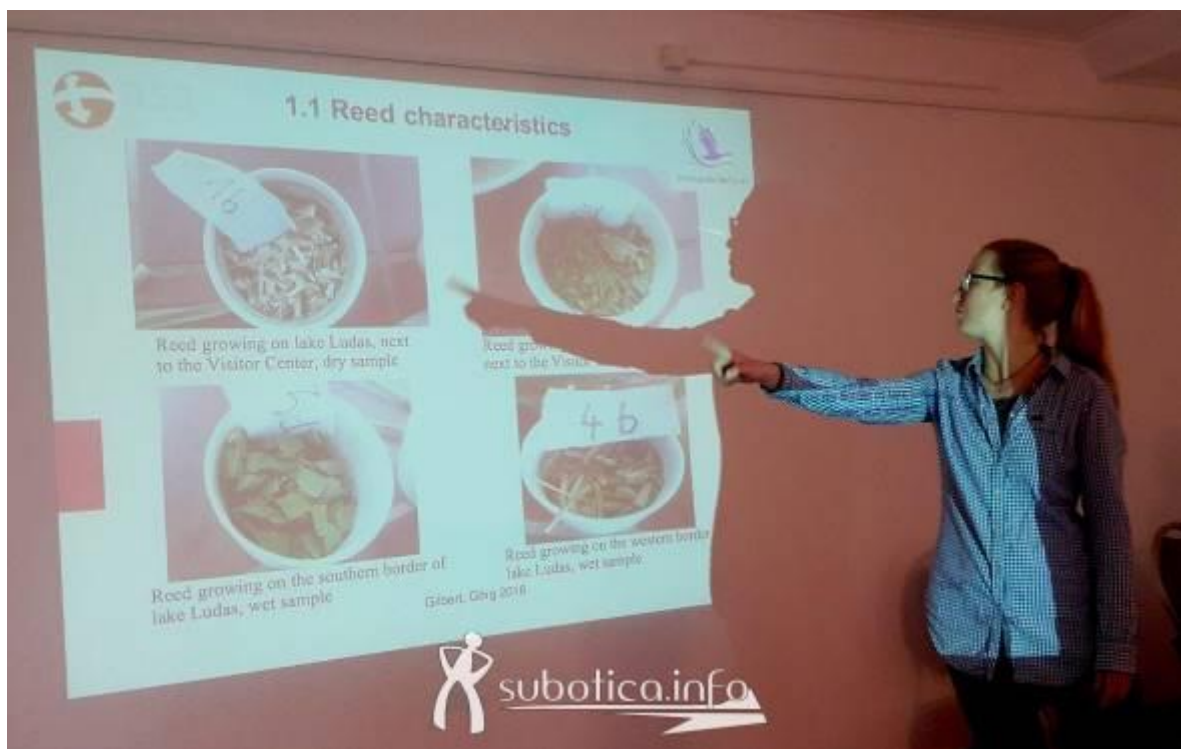
Слика 5. Презентација резултата у вези са ефикасном употребом трске

програма још није стигла до краја. Током године су две студенткиње из Немачке преко програма ASA учествовале у тромесечном програму који је требало да да резултате у вези са дугорочном употребом трске. Тачније, циљ њиховог боравка на Лудашком (и Палићком) је био да се направи процена количине трске, најефикаснији метод уклањања и одрживог управљања трском. Како се и очекивало, комбинација кошења (сузбијања), испаше и кошења у смислу економске експлоатације даје најбоље и једине одрживе резултате. Будући да је требало да се да предлог за могућност загревања Визиторског центра на Лудашу трском, резултати показују да би улагање било велико (у инфраструктуру), али да би се исплатило за наредних 6 – 8 година.