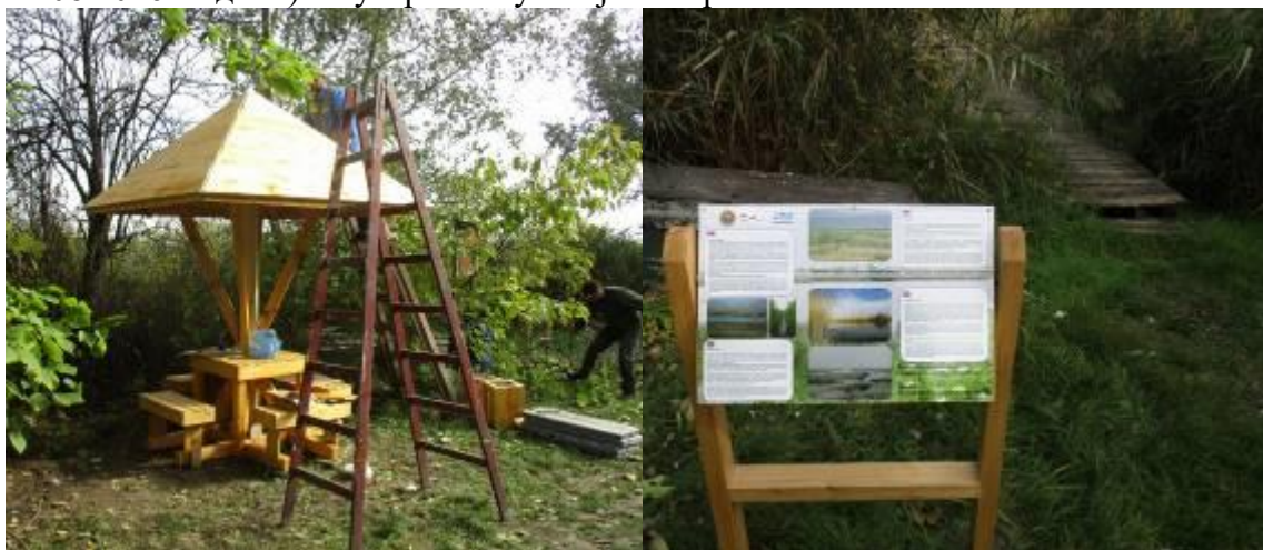
Слика 3. Нови елементи едукативне стазе на Лудашу

Током године је реализован пројекат Центра за истраживање и студије туризма – постављена је инфраструктура за бициклическу стазу (трасу) у Резервату. Постављени су путокази, информативне табле, клупе и надстрешнице. Иако се постављање десило у октобру месецу, велики део мобилијара је уништен и отуђен. За наведену активност је исходовано решење о условима заштите природе (03-1657/2 од 12.08.2016. године) и чуварска служба је контролисала све активности.