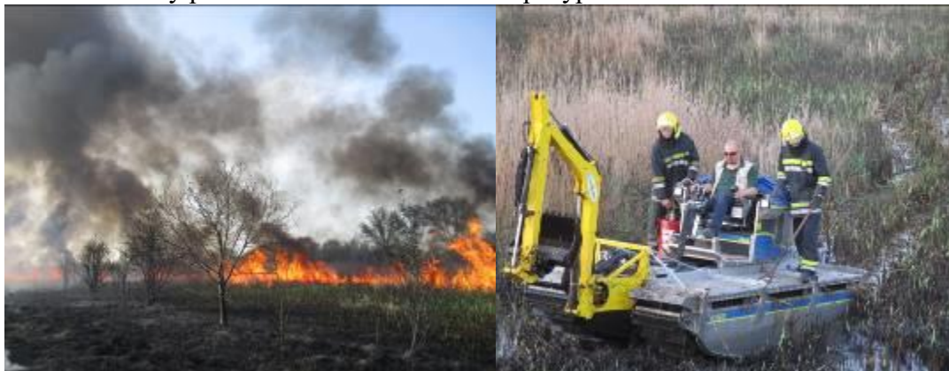
Слика 7. Пожар и гашење пожара у Резервату

Активности су реализоване из сопствених ресурса.