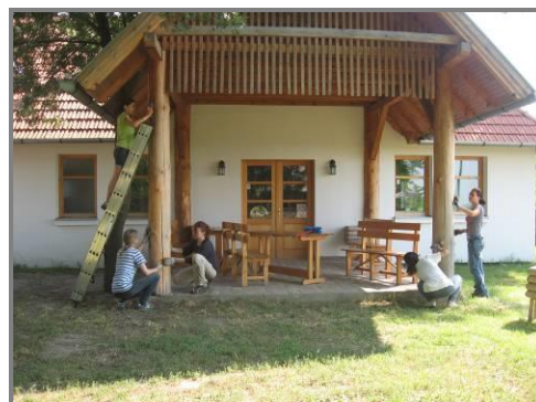
Слика 11.-12.-13.-14. Радови током Волонтерског кампа