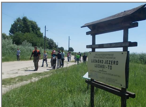
Слика 8. Шетња са волонтерима у Резервату