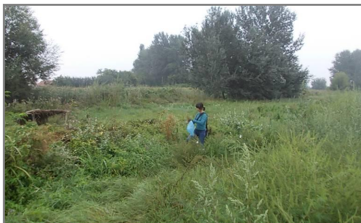
Слика 21. Сакупљање узорака инвазивних биљних врста

Докторске дисертације се реализују на Катедри за екологију и географију биљака на Биолошком факултету у Београду, а за реализацију истраживања на заштићеном подручју постоји Дозвола Министарства енергетике, развоја и заштите животне средине (Број: 353-01-289/2013-08 од 22.04.2013.) и Решење о условима заштите природе Покрајинског завода за заштиту природе (Број: 03-1284/2 од 03.09.2012.). Након теренског рада достављени су извештаји мониторинга са локалитетима бројем нађених врста.