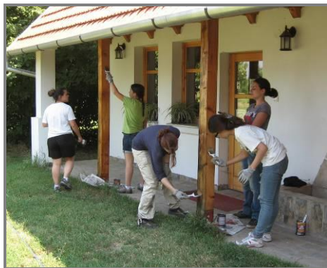
Слика 1.-2. Кошење и фарбање код Визиторског Центра „Лудаш“