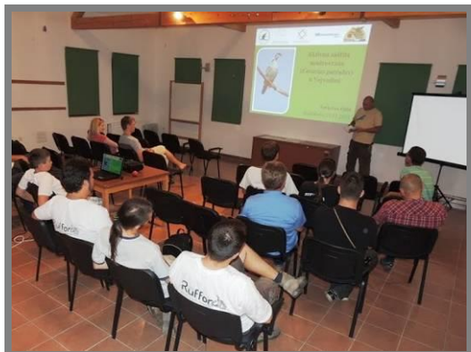
Слика 18. Предавање о заштите модроврана