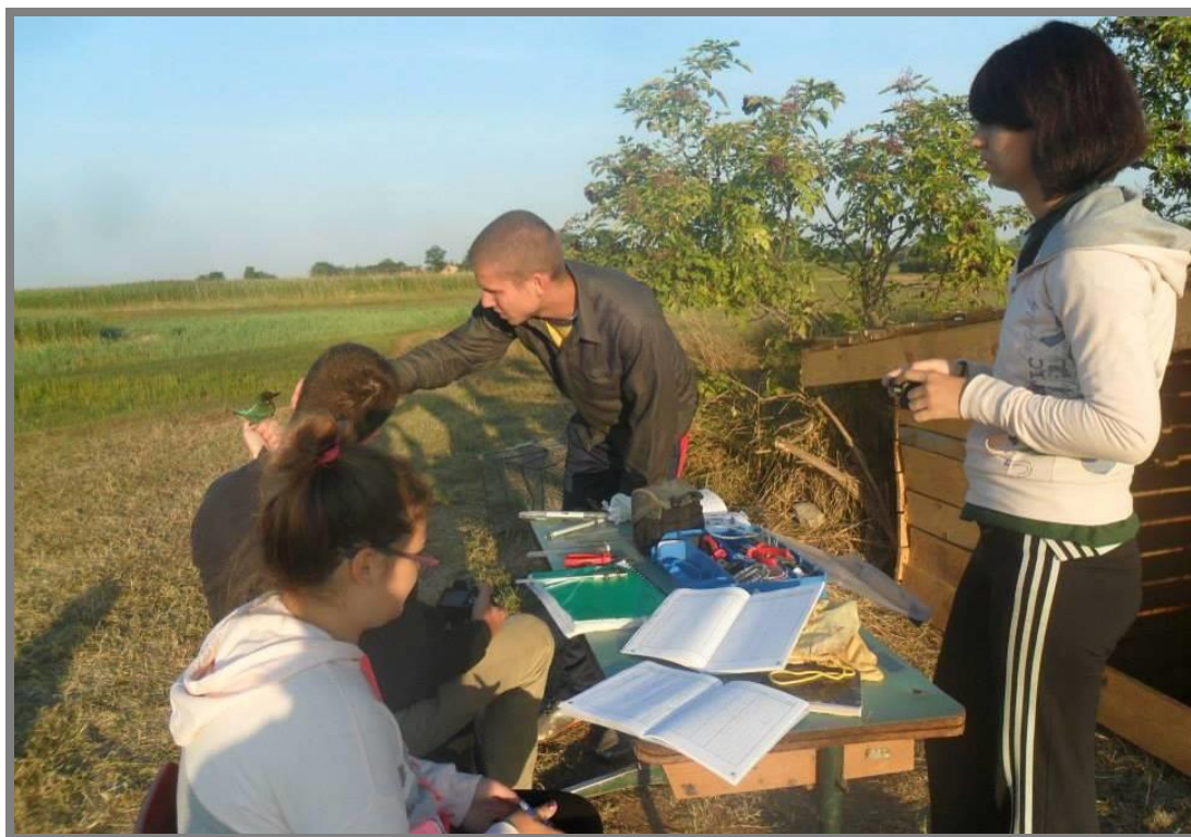
Слика 15. Рад на локалитету Птичарска колиба - прстеновање птица

Реализацију кампа, као и протеклих година, финансијски је потпомогла Управа града Суботице, бр. уговора II-401-923/2013.