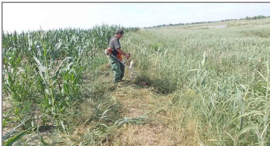
Слика 23. Кошење Високе обале Лудашког језера

Кошењем је одржавано и станиште са вегетацијом пешчарске ливаде (1 хектар) и одржаван појас заштитног зеленила са аутохтоним врстама. Радове је обављала чуварска служба, локално становништво и трећа лица