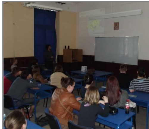
Слика 9. Обележен је дан Планете земље у Хемијско-техничкој школи у Суботици