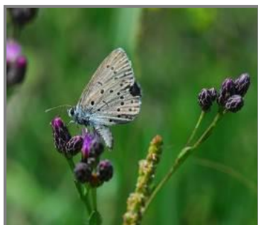
20. Слика Phengaris teleius