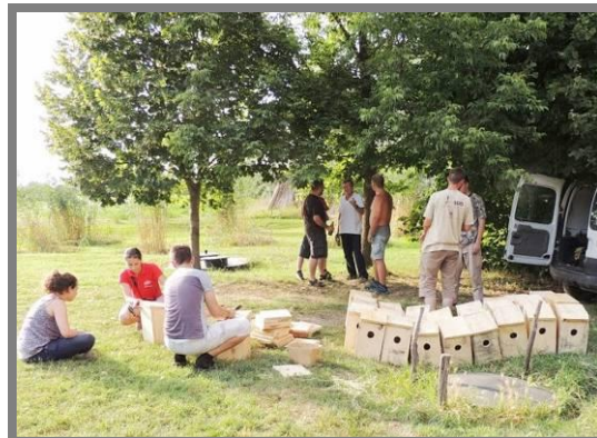
Слика 19. Вештачке дупље за модровране