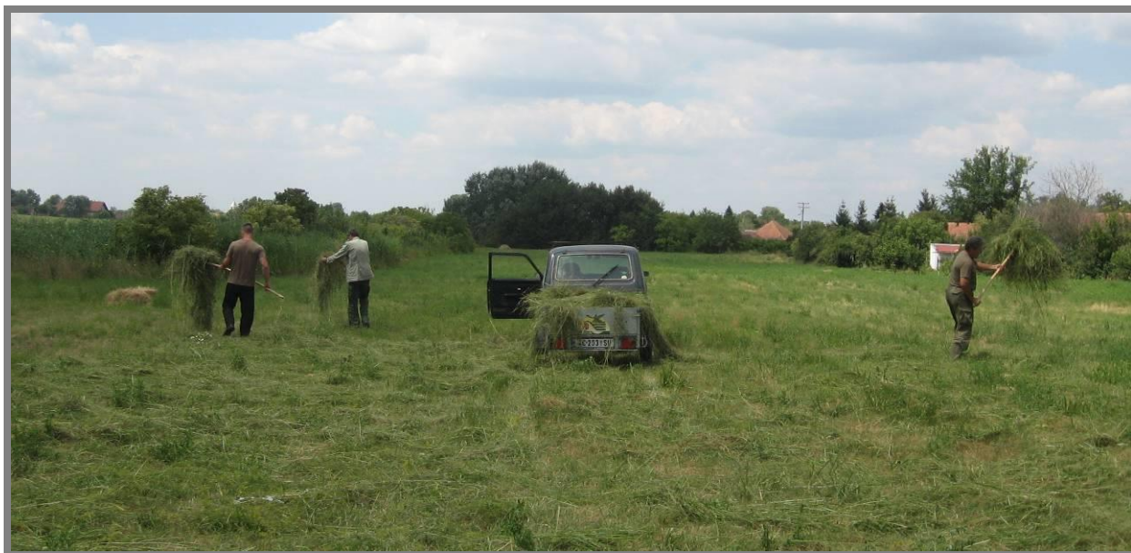
Слика 22. Ревитализација степске ливаде код Визиторског центра "Лудаш"

Обављено је кошење степске ливаде код Визиторског центра "Лудаш". Биомаса је однета, а у циљу ревитализације, на ливаду је нанета покошена трава донета са одговарајућег локалитета (степска ливада) у Специјалном резервату "Селевењске пустаре".