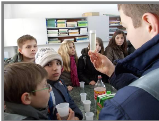
Слика 4.-5.-6.-7. Дан Специјалног резервата природе „Лудашко језеро“