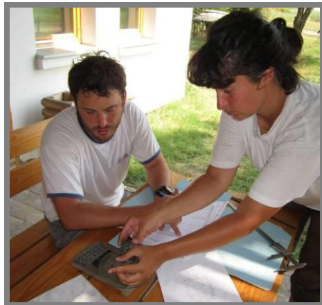
Слика 16. Проучавање барских корњача