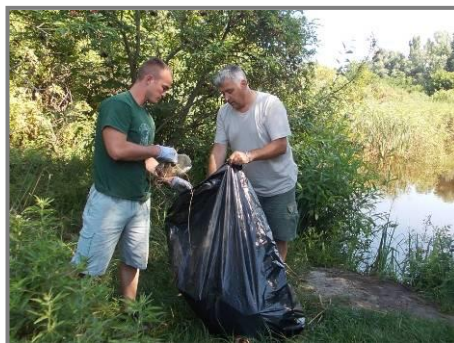
Слика 3. Сакупљање смећа поред Киреша