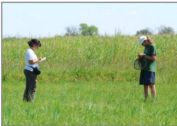
Слика 17. Лепидоптеролози на терену