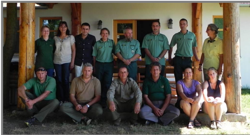
Слика 10. Посета сарадника и чувара природе Националног парка „Кишкуншаг“