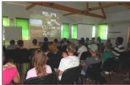
Слика 5. Предавање у Визиторском центру