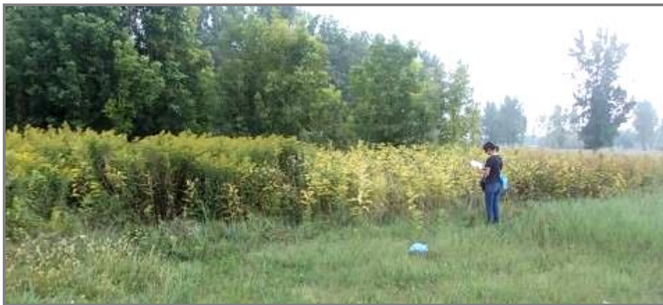
Слика 12. Мониторинг инвазивних алохотних биљних врста

Подаци се уносе у горе поменућу базу података и током 2014.године планира се даље бележење површина популација неких заштићених биљних врста путем GPS уређаја. Очекујемо Суфинансирање од Министарства природних ресурса рударства и просторног планирања, Фонда за животну средину Града Суботице и сопствених средстава.