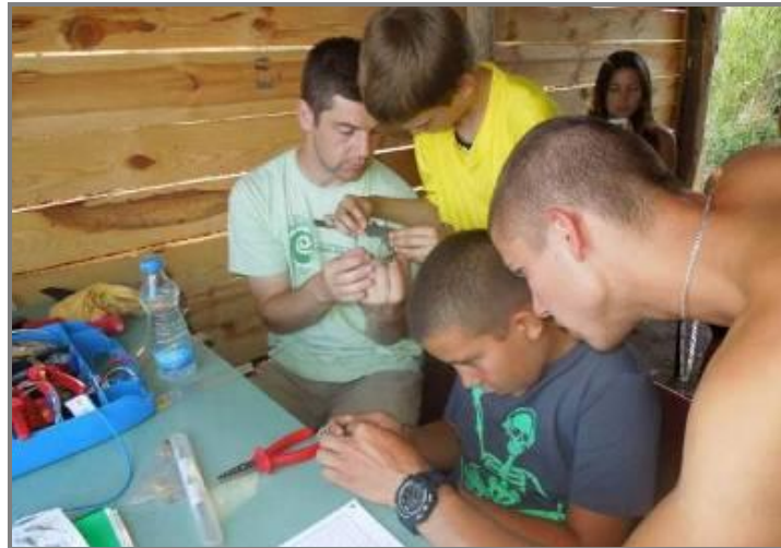
Слика 3. Рад у кућици за прстеновање птица

Финсирање из Фонда за животну средину Града Суботице и сопствених средстава.