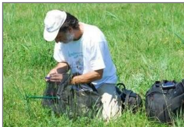
11. Слика Лепидоптеролог на терену