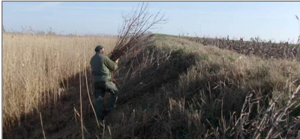
Слика 14. Источна висока обала Лудаша – Вађење дрвенастог подраста инвазивних врста (зова)

Спроводиће се и даље активне мере заштите орнитофауне (постављање дупљи, зимска исхрана, одржавање мира у Резервату током репродукције и миграције) који се финапсирају кроз програме удружења „Рипариа“.