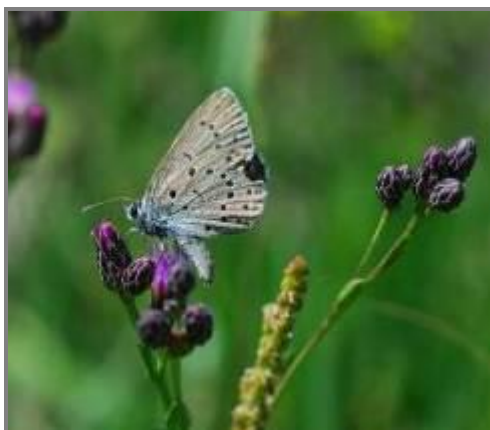
10. Слика Phengaris teleius

У оквиру израде докторске дисертације Милоша Поповића на студијама биологије у Крагујевцу, наставиће се истраживања на распрострањењу врсте Phengaris teleius . За активност постоји Решење о условима заштите природе природе Покрајинског завода за заштиту природе (Број: 03-504/2 од 21.05.2013.).