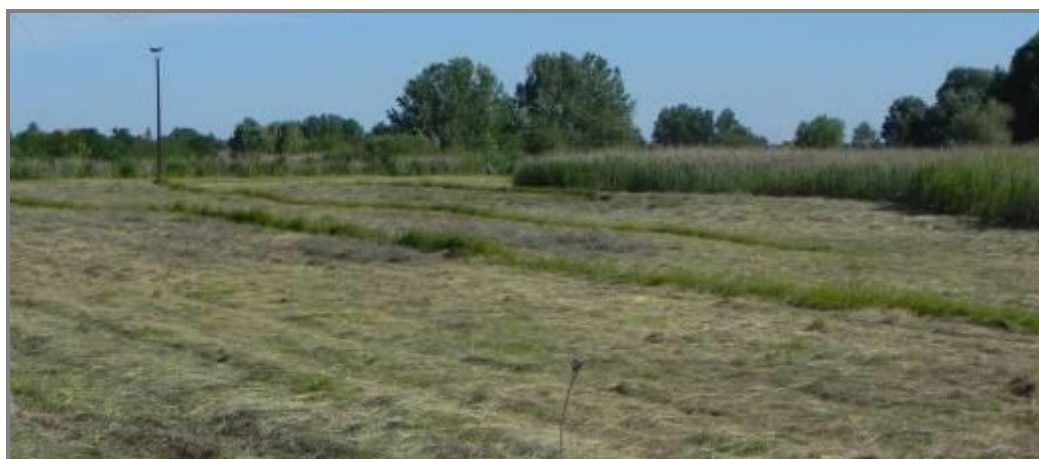
Слика 13. Кошење – Ушће Киреша

Наставак ревитализација на више локалитета станишта влажних ливада (код Птичарске колибе, ушће Киреша) спровођењем активних мера заштите - кошење ливада, кошење секундарних тршњака у току зиме и током вегетације, припрема могућности организовања испаше стоке, нарочито традиционалних раса. Активне мере спроводи мањим делом чуварска служба, а већим делом их управљач организује у сарадњи са локалним становништвом, уводећи модел одрживог коришћења (корисник може да добије биомасу уколико обави одређене активности на чишћењу угрожених локалитета). Током године се планира прикупљање теренских података и израда програма ревитализације станишта влажних ливада на подручјима Чурго и Киваго. Суфинансирање од Фонда за животну средину Града Суботице и сопствених средстава.