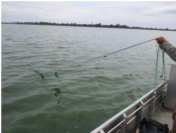
Egy a kiemelt hálóból